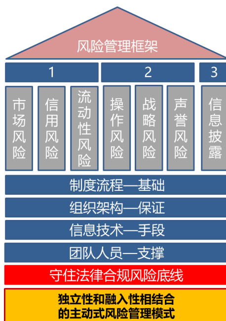
图 2：公司风险管理框架

对于流动性风险，公司提前分析，积极应对，本报告期内未发生流动性风险事件。2019年，公司亦未发生重大操作、合规、声誉风险事件。